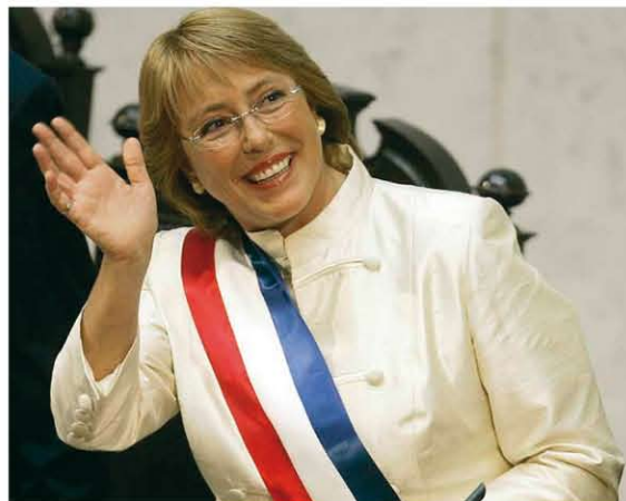
Michelle Bachelet, Presidente del Cile

La leader socialista rinnoverà la compagine di governo elevando la presenza femminile al suo interno, e intende "aggredire" immediatamente i problemi del Cile. Al proposito ha elaborato un 'Piano 100 giorni, 36 impegni' che si concentrano sulla creazione di posti di lavoro, specialmente per i giovani, e sulla riforma del welfare in senso solidaristico. Per quanto riguarda il mercato del lavoro, il programma prevede l'ampliamento dei benefici per i contratti d'apprendistato, nonché un progetto di legge che consente ai giovani fino a 25 anni di lavorare ad ore. Intende portare da 110.000 a 160.000 il numero dei giovani beneficiari di crediti e borse di studio per l'istruzione superiore. Allo studio anche un Codice con nuove misure a favore delle donne nel mondo del lavoro. Sul welfare il programma prevede l'aumento delle pensioni minime, cure ospedaliere gratuite per