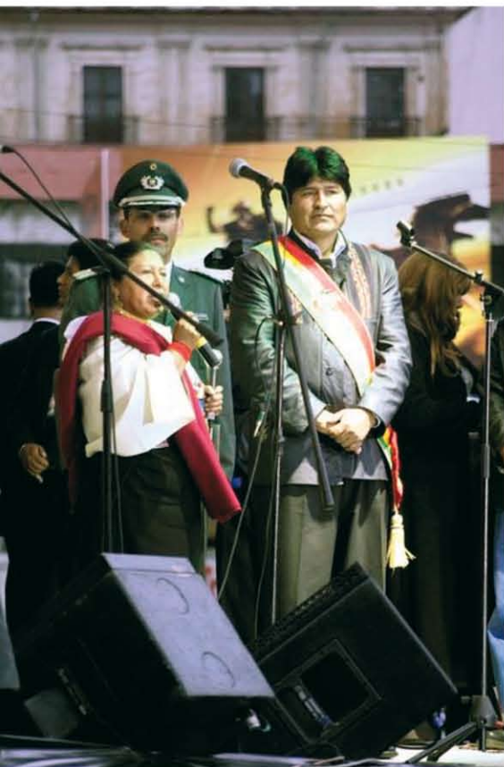
Presidente del Bolivia, Evo Morales