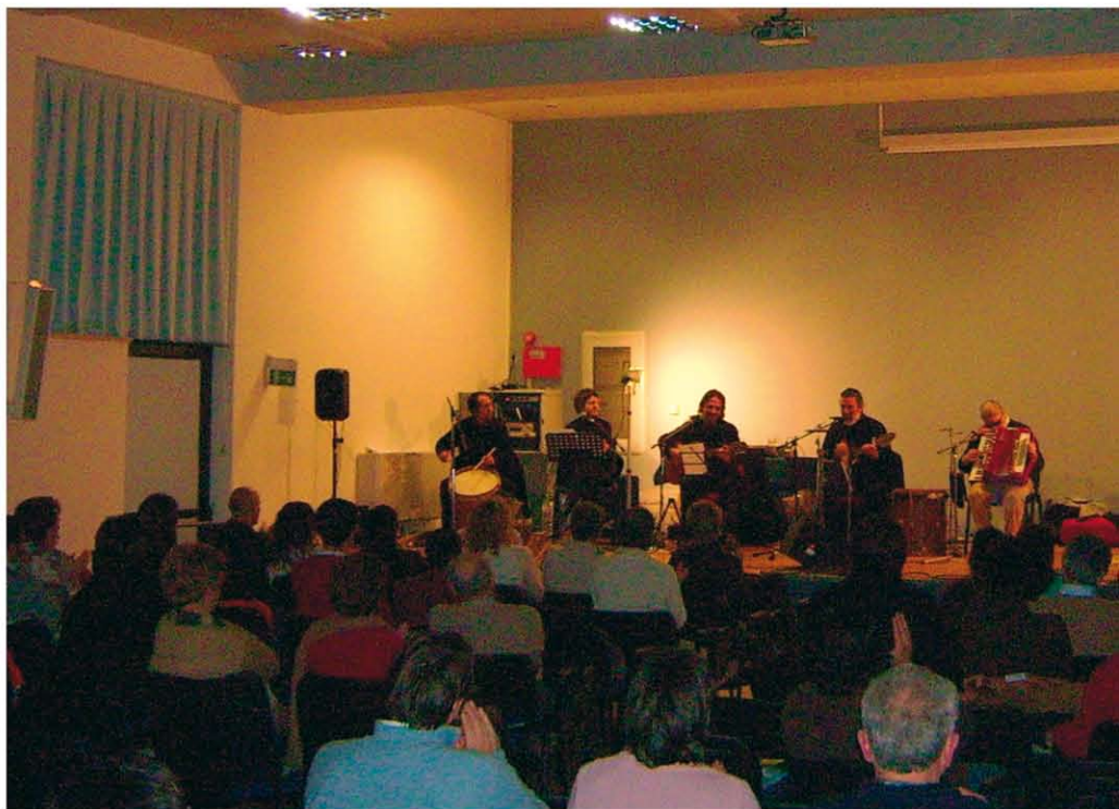
Sopra: un momento del concerto organizzato a Rezzato.