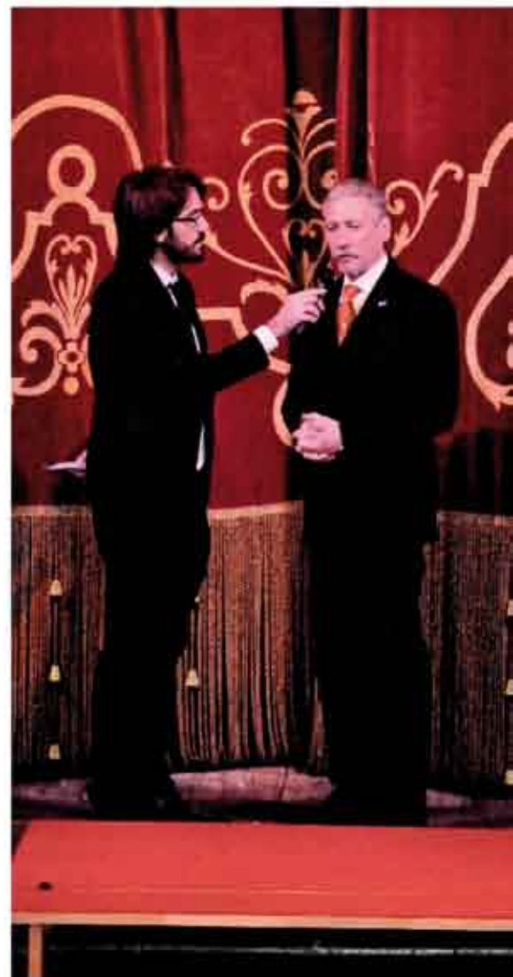
A destra Amb. Gustavo Moreno Ambasciatore Generale del Consolato Argentino a Milano