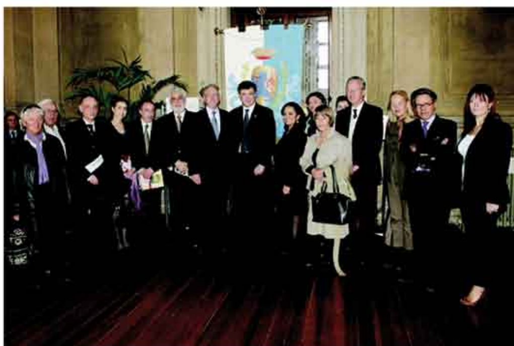
A destra Rappresentanze consolari del Latinoamerica